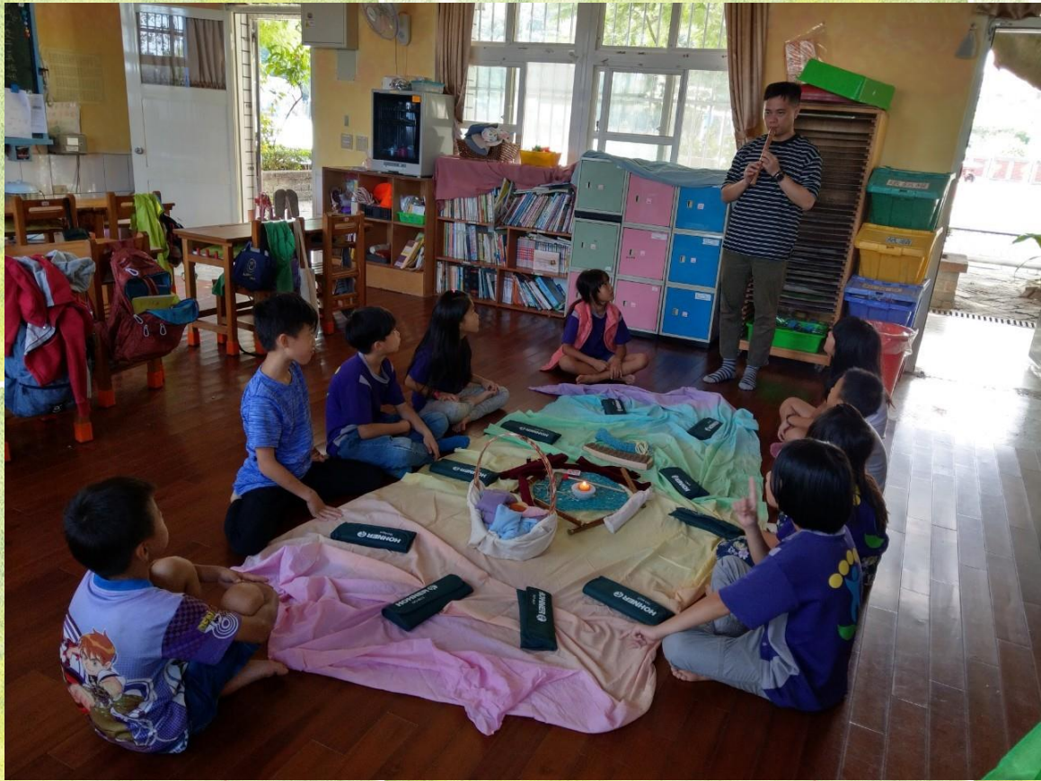
(七音笛開笛儀式：透過儀式，讓孩子珍惜樂器並吹奏正確的音色)